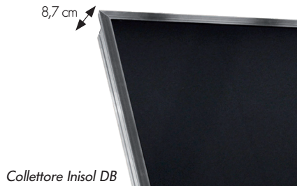
Collettore Inisol DB