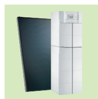
TWINEO EGC 25 / V 200SSL