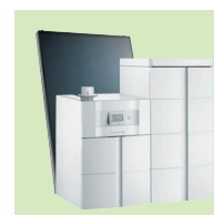
TWINEO EGC 25 / B 200SSL

Per ulteriori informazioni, inserite questo codice: