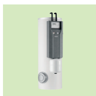
Inisol UNO da 200 l a 400 l